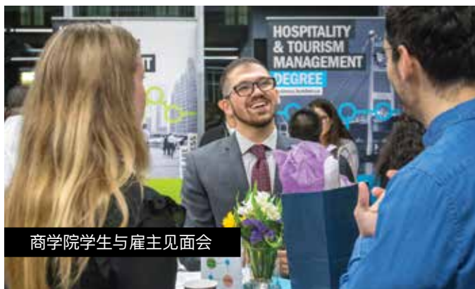
商学院学生与雇主见面会

➔ 欲了解更多信息，请访问： careers.humber.ca/student-careerconnect